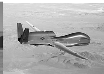
無人偵察機「グローバルホーク」