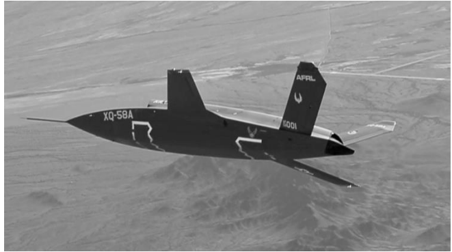
AI搭載殺人ドローン